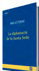
La diplomacia de la Santa Sede Nikola Eterović Sal Terrae, 2024 384 páginas, 26,60 €