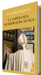
La esperanza no defrauda nunca Papa Francisco Mensajero, 2024 175 páginas, 14,25 €

en nuestra vida cotidiana. Francisco se vale de rostros concretos: una mujer embarazada, un migrante, un pobre, un abuelo..., para animarnos a «hacer esfuerzos concretos de confianza en Dios y así caminar en la luz». ●