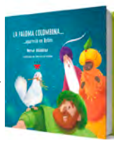
La paloma Colombina Hervé Alústiza PPC, 2024 48 páginas, 18,90 €